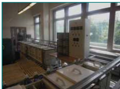
Рис. 1. Линия прямой металлизации и линия гальванического осаждения меди и металлорезиста