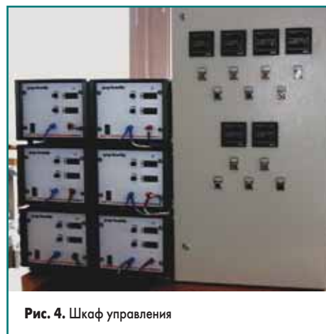
Рис. 4. Шкаф управления